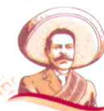
MARÍA ELENA ÁLVAREZ-BUYLLA ROCES DIRECTORA GENERAL

El Conahcyt se ha trazado nuevas metas y horizontes. Sólo mediante la restauración la ética pública será posible contribuir a la construcción de una auténtica Ciencia por México que redunde en el desarrollo y bienestar del pueblo.