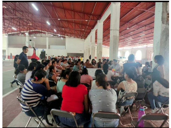
Mesas de trabajo en Cuetzalan del Progreso.

A su vez, la redacción de los artículos se realiza con lenguaje incluyente y no discriminatorio, que permita avanzar en el respeto y garantía de los derechos humanos reconocidos y tutelados por nuestra Carta Magna , los tratados internacionales y leyes que de ella emanan, conforme al Artículo Primero Constitucional .