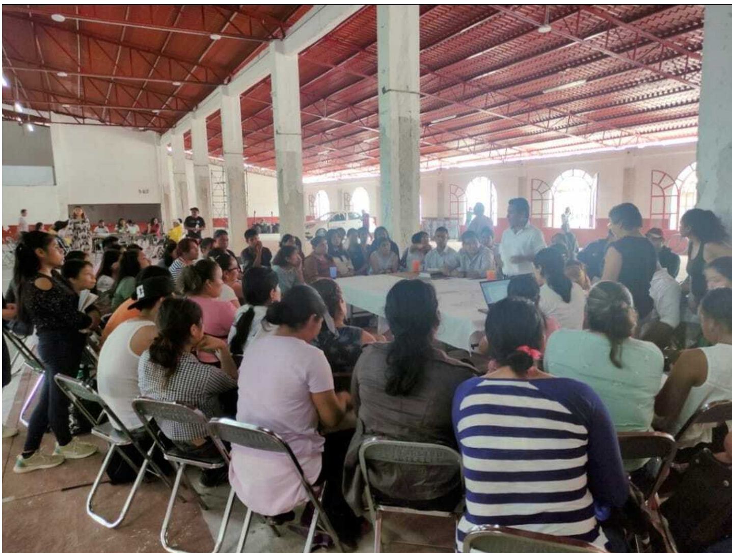
Mesas de trabajo Cuetzalan.

Una vez establecido la exposición de motivos, planteamiento del problema o los argumentos que la sustentan, que son el fundamento teórico y normativo de las propuestas, se establecen los Capítulos y Artículos que se proponen adicionar o, en su caso, reformar. Si bien en los Ayuntamientos no se exigen – ni se siguen de manera cotidiana – las formalidades de las prácticas parlamentarias y técnica legislativa, se propone seguir éstas para facilitar el análisis, discusión y, en su caso, aprobación, de las propuestas que se elaboren en el marco de Proyecto, y que seguirán el trámite en las Direcciones/Secretarías, las Comisiones Municipales del Ramo y, por consiguiente, en el Cabildo.