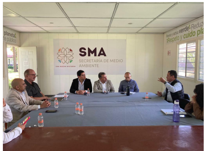
Reunión de trabajo con autoridades estatales de la Secretaría de Medio Ambiente del estado de Tlaxcala.

También, se analizó la situación actual en México desde la perspectiva municipalista, es decir, se reflexionó sobre problemática de los residuos sólidos, el daño que actualmente existe en el territorio municipal, cuánto y cómo participan las vecinas y vecinos, el presupuesto de los Ayuntamientos, y todas aquellas características que marcan diferencias entre municipios.