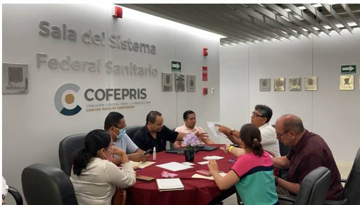
Reunión de trabajo con autoridades municipales de Acapulco de Juárez.

En el año 2022, durante los primeros seis meses del proyecto, se realizó un análisis pormenorizado sobre cada una de las normas jurídicas internacionales, nacionales, estatales y municipales relacionadas con la protección al medio ambiente y la GIRSU. Esto fue la base para la elaboración de propuestas de reforma a ordenamientos jurídicos estatales y municipales.