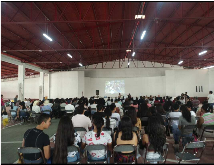
Foro Informativo en Cuetzalan del Progreso.

La construcción de los reglamentos se realiza no solo en coordinación con las autoridades municipales, sino con las personas que habitan esos municipios, a través de foros de consulta, mesas de trabajo, entrevistas, entre otros mecanismos, con los cuales se busca identificar las necesidades de la población y el impacto diferenciado de los daños ecológicos entre las personas.